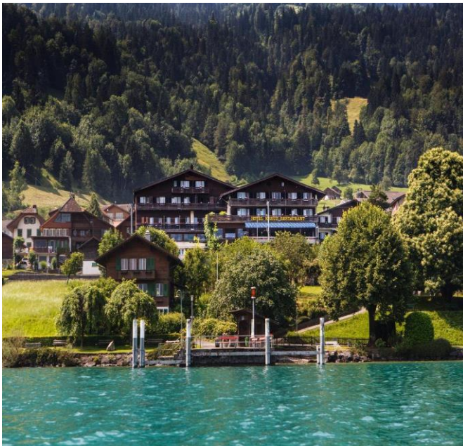
Vue de l'hôtel Kreuz depuis le lac