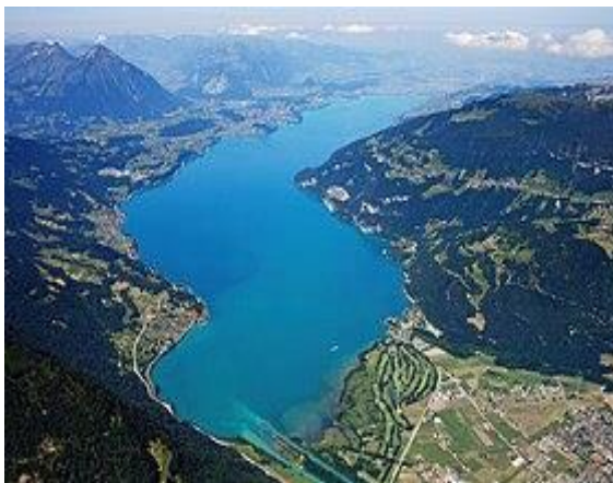
Le Lac de Thune