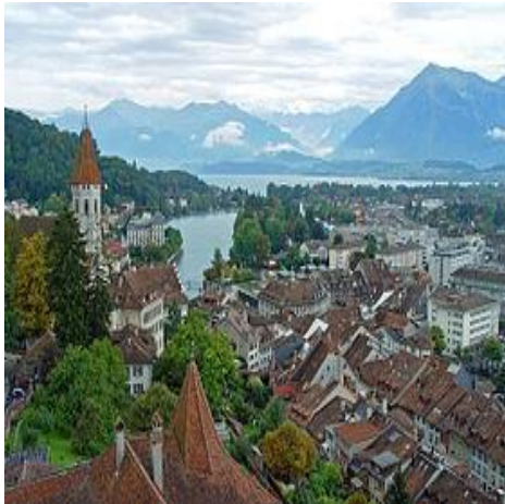
Lac de Thoune et ville de Thoune